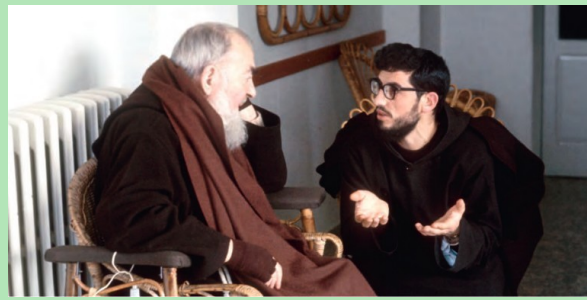
Saint Padre Pio

Le Fils de Dieu s'est incarné Avec Lui, tu vis, crucifié Dans la souffrance et dans la joie L'Amour n'est pas mort sur la Croix.