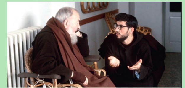
Saint Padre Pio

Le Fils de Dieu s'est incarné Avec Lui, tu vis, crucifié Dans la souffrance et dans la joie L'Amour n'est pas mort sur la Croix.