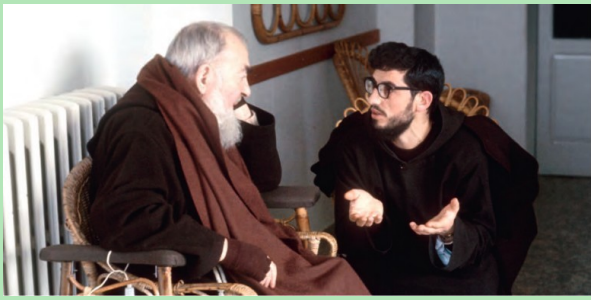
Saint Padre Pio

O Saint Padre Pio, quand Dieu s'est invité Au secret de ton cœur, tu as tout accepté, A l'appel de François, le grand stigmatisé Tu veux suivre Jésus, ton frère en pauvreté.